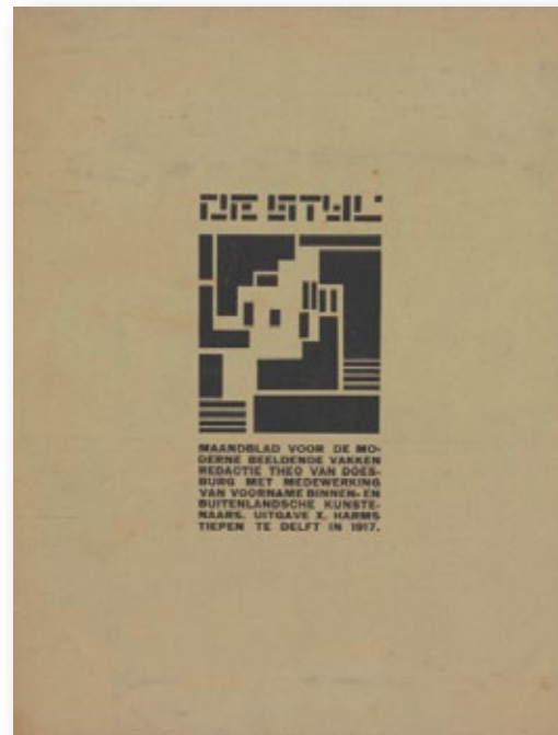
THEO VAN DOESBURG

Bundelen van de statements in een manifest, een mooi vormgegeven krant. Ten behoeve daarvan wordt een redactie gevormd van professionals. Wie gaan we in de redactie samenbrengen ook daar-