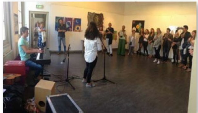
Op 12 juni de opening van de tentoonstelling van YOUNG STARS