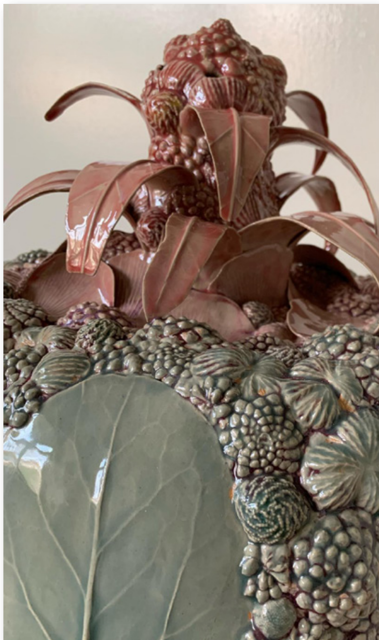
WERK VAN BRIGITTE PAALVAST