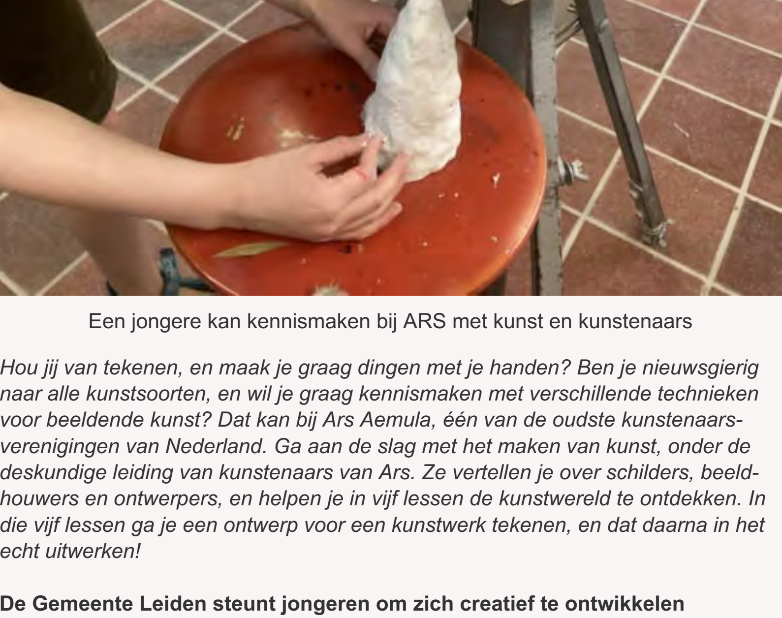
Een jongere kan kennismaken bij ARS met kunstenaars

Met de focus op kunst, creatieve ideeën en maakbare plannen kun je bij ARS met professionele kunstenaars aan het werk. We onderscheiden basisschool-groepen en VO-groepen. Daarnaast hebben we een Talentenklas. De Young stARS doen ook weer een duit in het zakje.