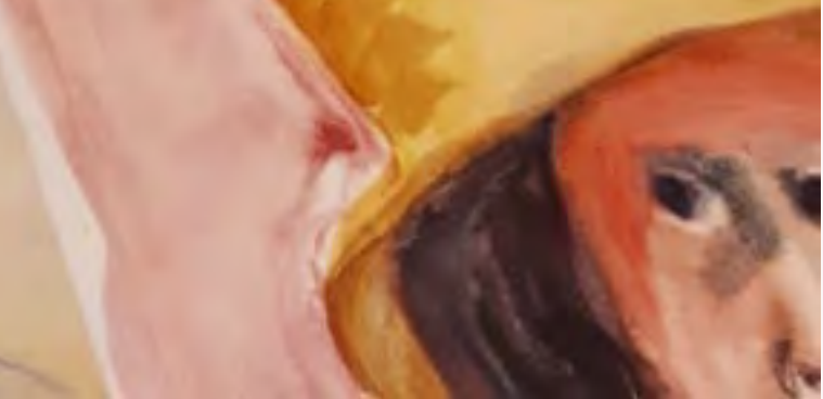
Stanley Rous: Engelse journalist en de latere president van de Wereldvoetbalbond FIFA

Beiden waren van mening dat de intense (illegale) contacten die er tijdens de oorlog tussen de twee landen waren, na de oorlog voortgezet moesten worden. Op deze manier konden de verschrikkelijke oorlogservaringen gedeeld worden: eerst uithuilen en daarna weer samen lachen. Na de oorlog werd in Nederland de "Landelijke organisatie ter bevordering van het Engels- Nederlandse Sportcontact" opgericht. Deze bracht 40 contacten tot stand tussen steden in Engeland en Nederland. Leiden kreeg als oude universiteitsstad de nog veel oudere universiteitsstad Oxford toegevoegd.